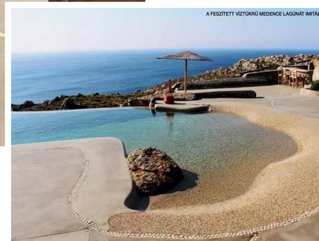
A FESZÍTETT VÍZTŰKRŰ MEDENCE LAGÚNÁT IMITÁL

A villa kőhomlokzatával szinte eggyé válik a sziklás vidékkel. Szokatlan megoldás erre felé, hisz a sziget, sőt, szigetcsoporthoz – melynek legismertebb tagja Szantorini –, adja a klasszikus görögnek gondolt építészeti stílus alapját. A képeslapra illő hófehér, ívekkel, boltozatokkal megtört házak élénk kék ajtó- és ablakkeretei valójában az Égei-tenger közepén található kiklád kultúra produktumai. Olyannyira, hogy a szigeteken fellobbanó villaépítési láz miatt a hatóságok csak a kiklád stílus kódjának megfelelő házakra adnak engedélyt. Ezúttal azonban kivételt tettek, nem véletlenül.