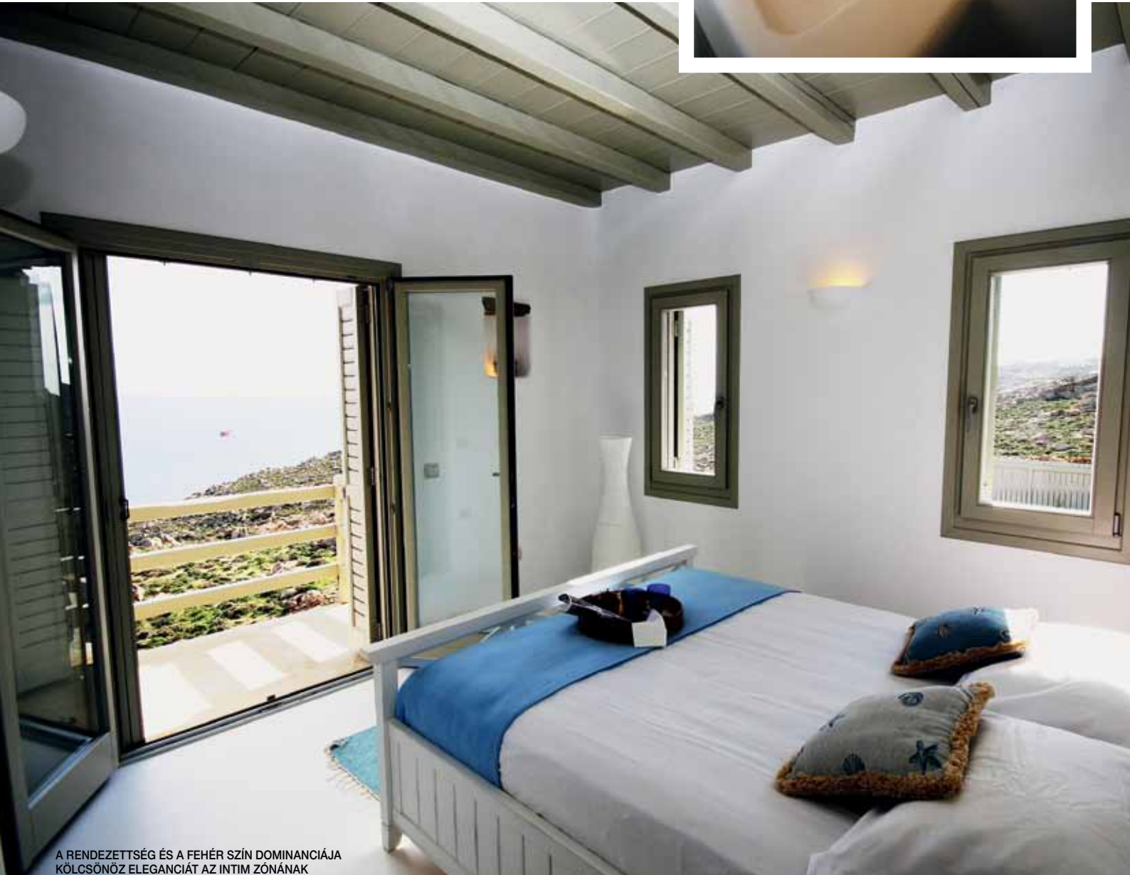
A RENDEZETTSÉG ÉS A FEHÉR SZÍN DOMINÁNCIÁJA KÖLCSÖNÖZ ELEGANCIÁT AZ INTIM ZÓNÁNAK